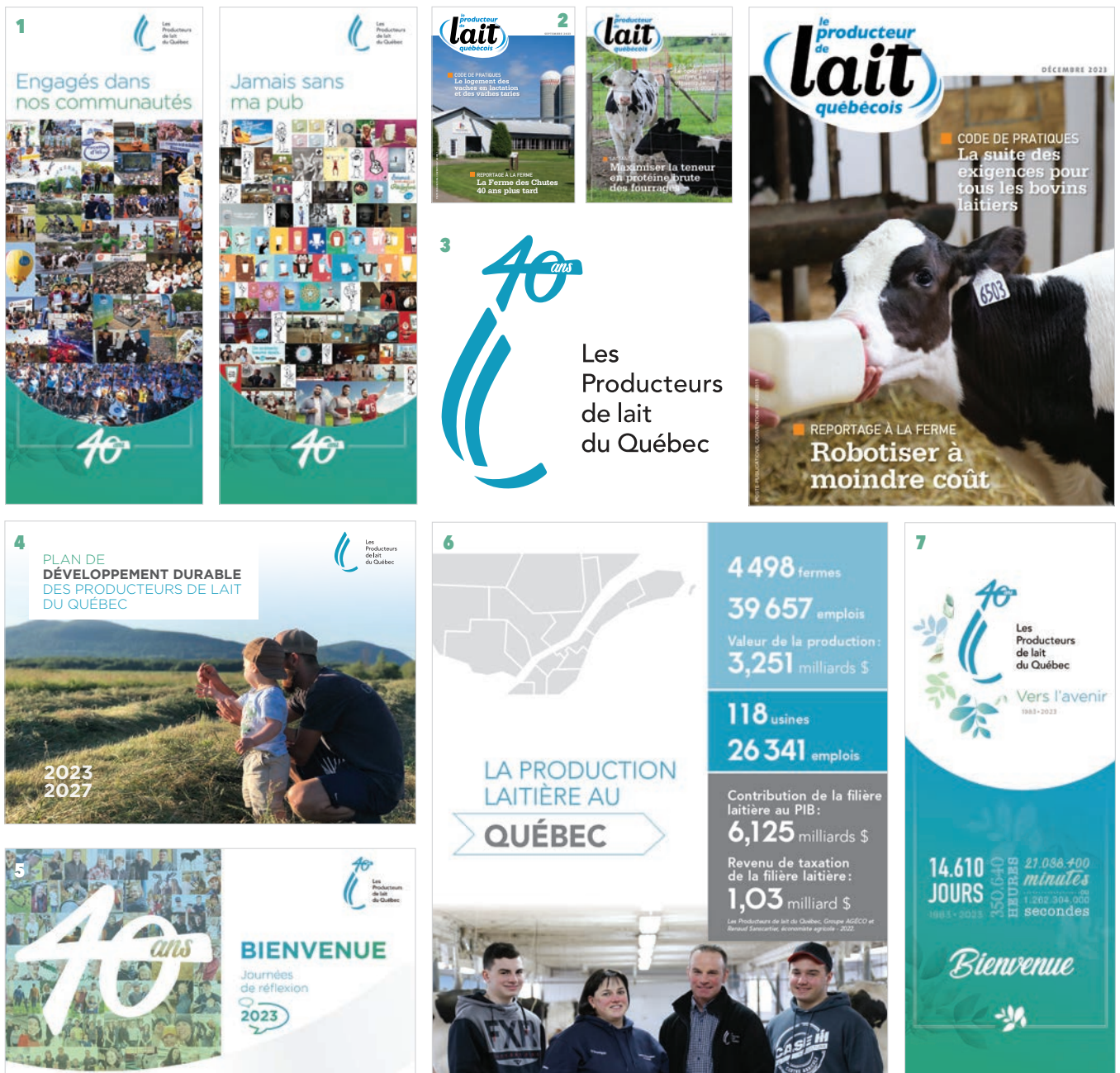
1 Exposition photo hommage pour les 40 ans de l'organisation 2 3 des 10 éditions 2023 de la revue Le producteur de lait québécois 3 Logo créé pour le 40 e anniversaire 4 Page couverture du Plan de développement durable 2023-2027 5 Visuel des Journées de réflexion 2023 6 Affiche sur les retombées économiques au Québec en 2023 7 Bannière exposée à l'assemblée générale annuelle 2023

En 2023, Les Producteurs de lait du Québec ont célébré leur 40 e anniversaire. Un plan de communication a été élaboré et mis en œuvre, une rubrique d'articles a été publiée dans la revue, des pages thématiques ont été développées et une exposition photo hommage a été présentée à l'assemblée générale annuelle.