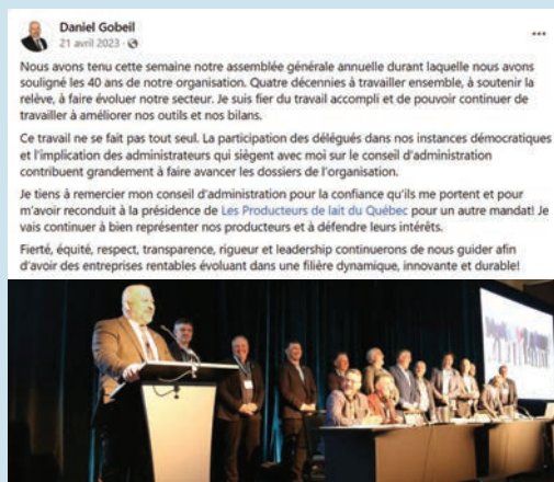
Publication sur la page Facebook de Daniel Gobeil, président des Producteurs de lait du Québec