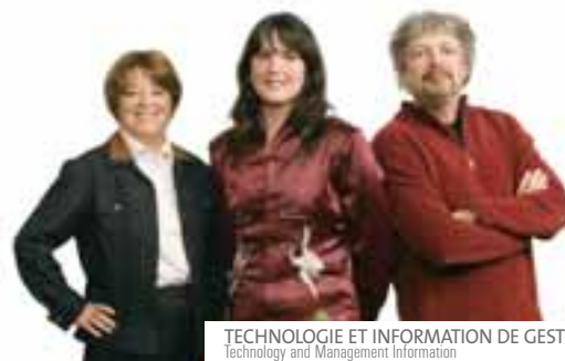
TECHNOLOGIE ET INFORMATION DE GESTION Technology and Management Information