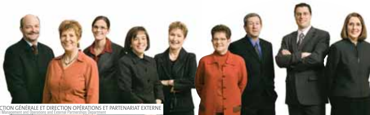
DIRECTION GÉNÉRALE ET DIRECTION OPÉRATIONS ET PARTENARIAT EXTERNE General Management and Operations and External Partnerships Department