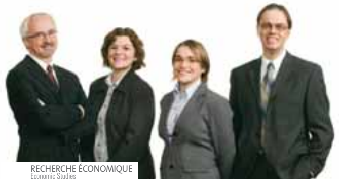
RECHERCHE ÉCONOMIQUE Economic Studies